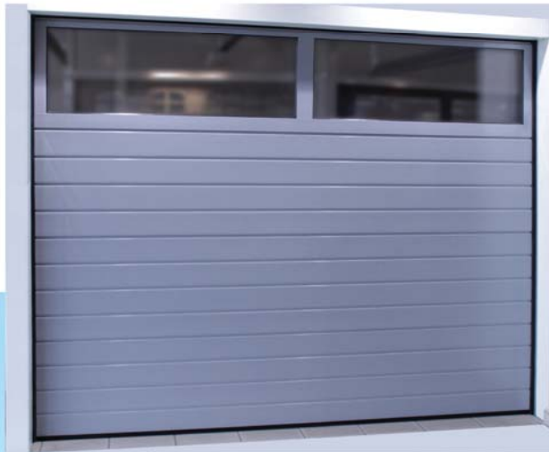
3-fach Sicke mit Fensterband