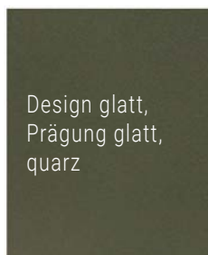
Design glatt, Prägung glatt, quarz