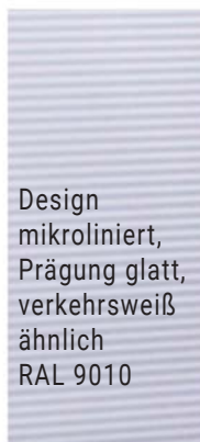
Design mikroliniert, Prägung glatt, verkehrsweiß ähnlich RAL 9010