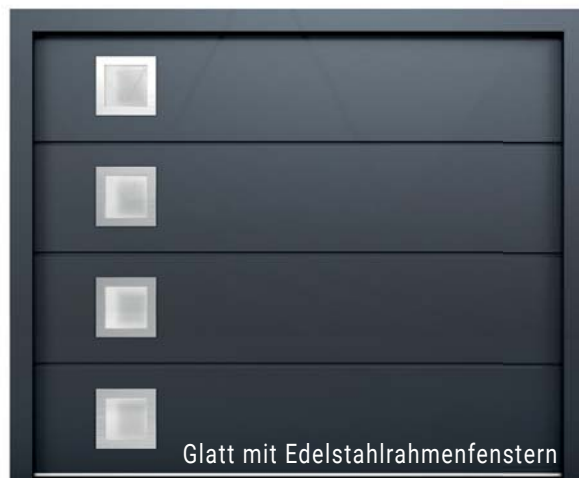
Glatt mit Edelstahlrahmenfenstern