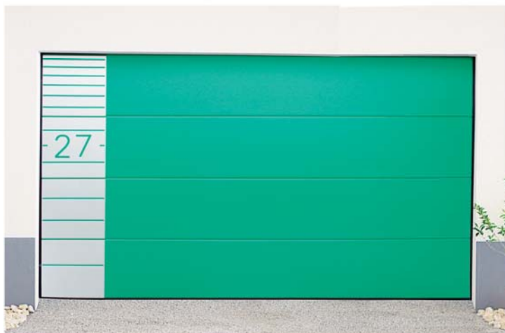
Auflagen aus Edelstahl mit Wunschmotiven