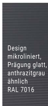
Design mikroliniert, Prägung glatt, anthrazitgrau ähnlich RAL 7016