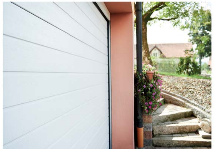
Design 3-fach Sicke, Prägung stucco