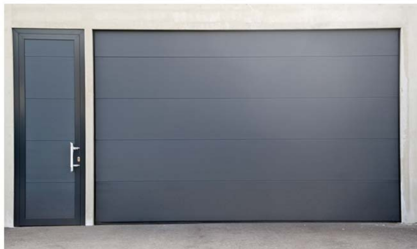
Design glatt, Prägung glatt, antra mit Garagentüre