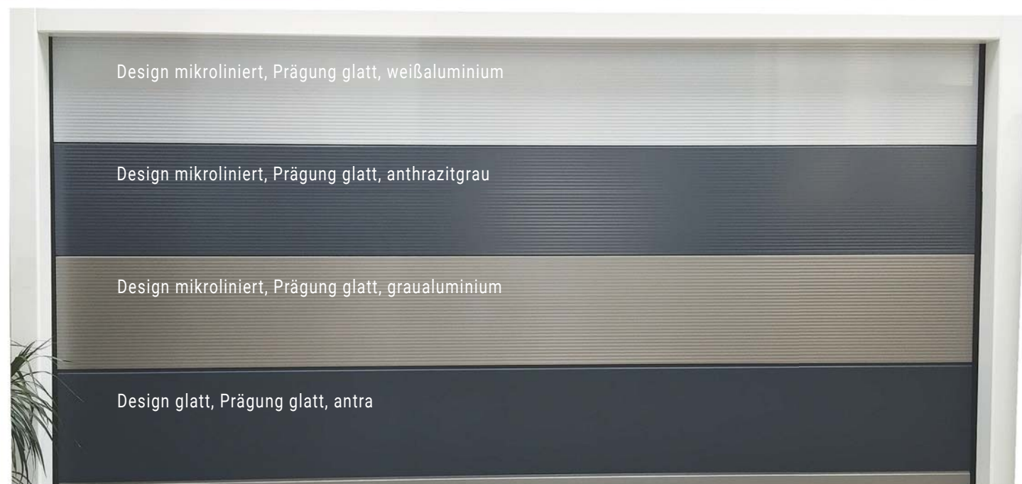
Design mikroliniert, Prägung glatt, weißaluminium