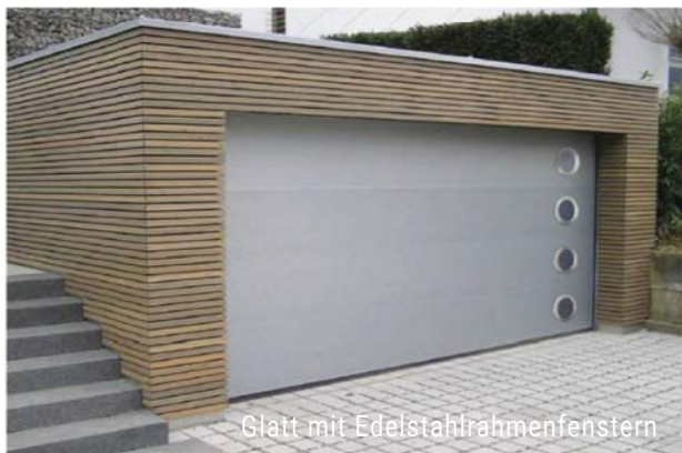
Glatt mit Edelstahlrahmenfenstern