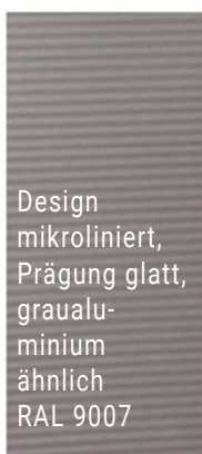
Design mikroliniert, Prägung glatt, graualu- minium ähnlich RAL 9007