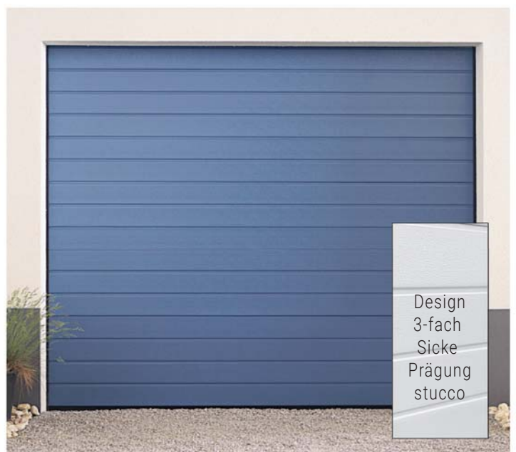
Design 3-fach Sicke Prägung stucco