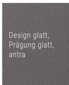
Design glatt, Prägung glatt, antra