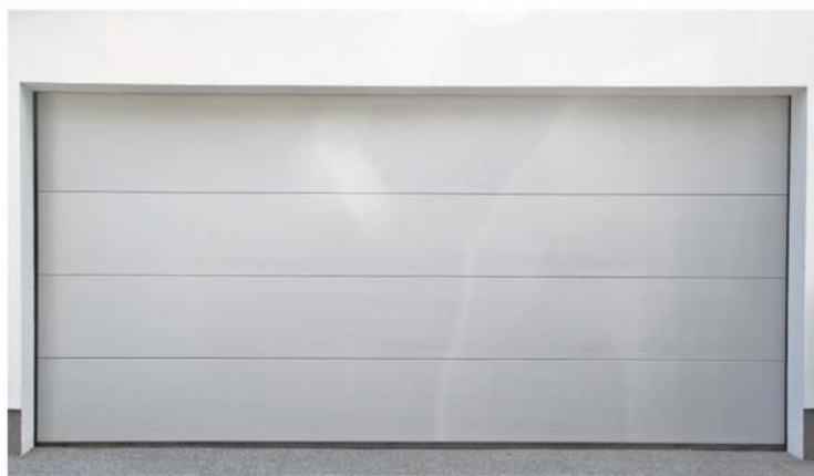
Design mikroliniert, Prägung glatt, weißaluminium

Neue Oberflächen und Farben, zur zeitgemäßen Architektur passend