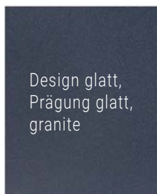
Design glatt, Prägung glatt, granite