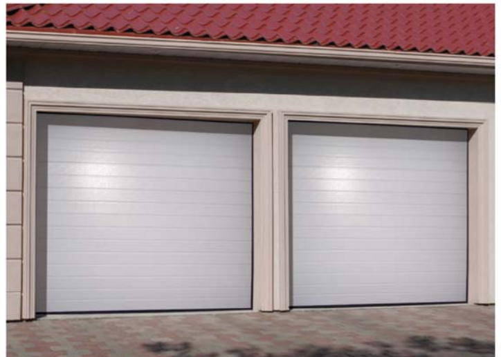
Design 3-fach Sicke, Prägung stucco